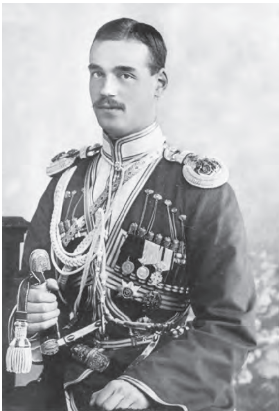
Великий князь Михаил Александрович Романов

двое неполных суток числился царем российским 2 . А ныне слава его как преображенного царя уже гремит более полувека на небесах.