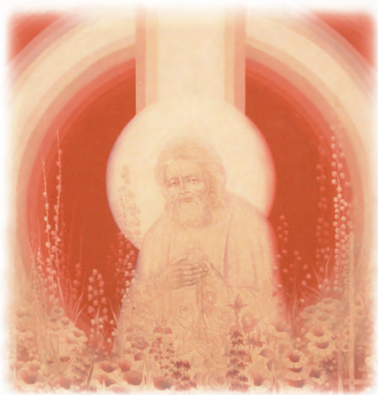
Вл. Серафим: Старец Серафим Саровский, чье имя я ношу, был архетипическим солнцем русской святости, не зависящей ни от времени, ни от истории. (с. 15) Фрагмент картины митр. Стефана (Линицкого).