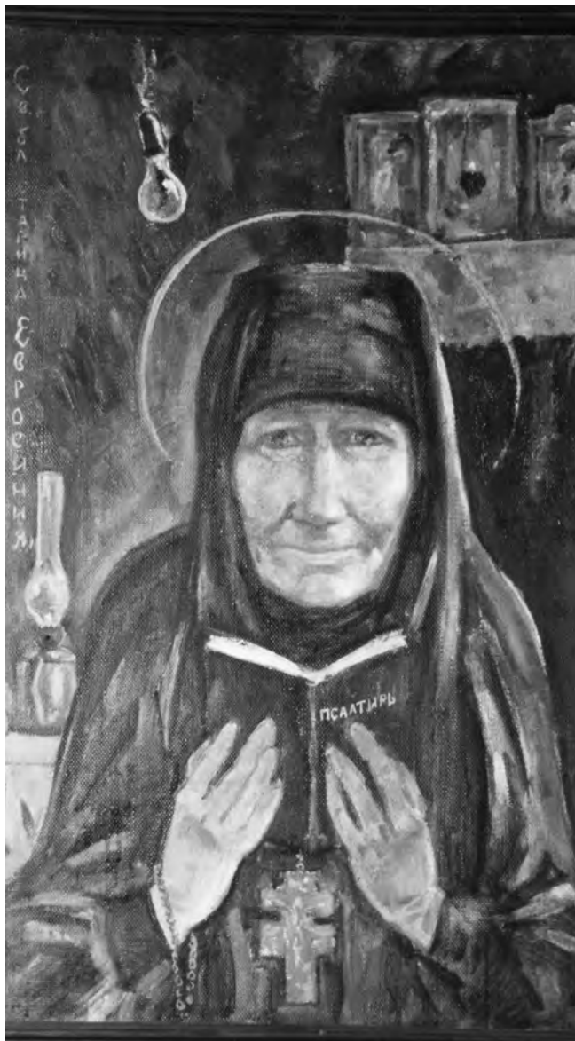
ИКОНА РАБОТЫ О. АРТЕМИЯ (ТУТУНОВА)